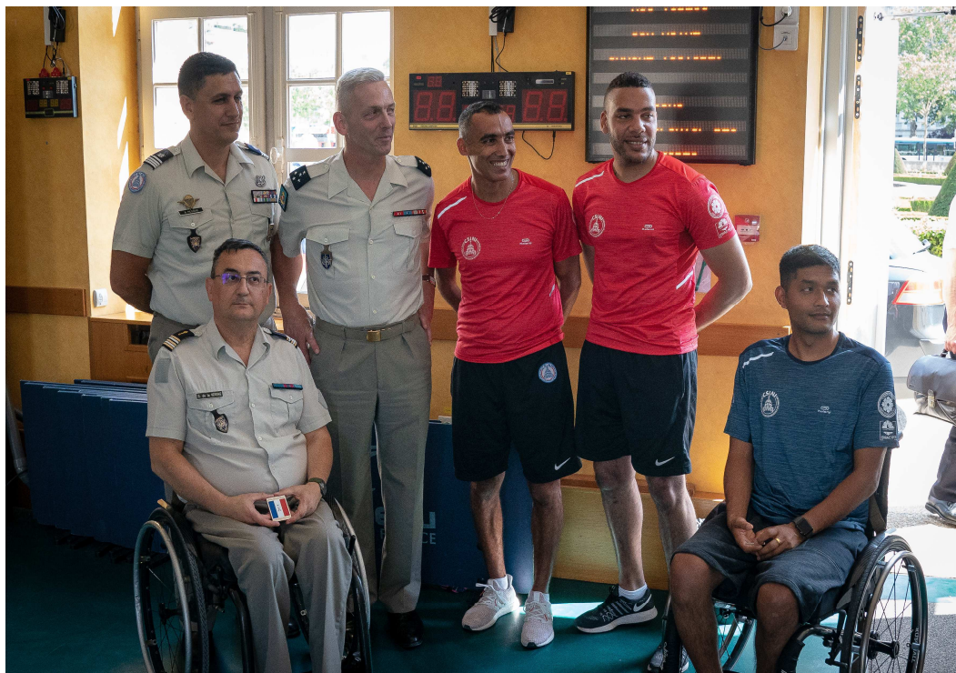
Le Général d'armée François LECDINTRE et la délégation du CSINI

Le vendredi 6 juillet dernier le général d'armée François LECDINTRE, chef d'état major des Armées (CEMA) a été accueilli à l'Institution Nationale des Invalides pour sa première visite officielle.